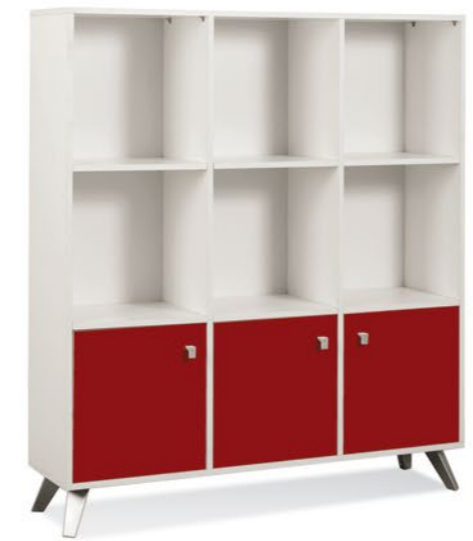
Módulo de 3 cuerpos LE110 Medidas (An/AI/Prof): • 1153 x 1417 x 301 mm

Los productos del presente catálogo, sus dimensiones, terminaciones y colores, están sujetos a variación. Las imágenes son meramente ilustrativas.