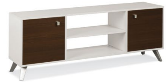
Rack para TV RE140 Medidas (An/AI/Prof): • 1399 x 625 x 355 mm