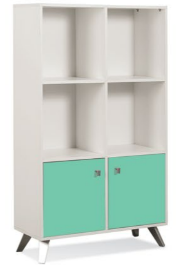
Módulo de 2 cuerpos LE075 Medidas (An/AI/Prof): • 775 x 1417 x 301 mm