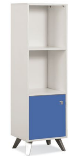
Módulo de 1 cuerpo LE040 Medidas (An/AI/Prof): • 399 x 1417 x 301 mm